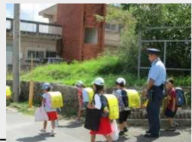
通学路のパトロールの実施状況