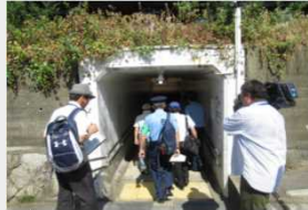
合同点検の実施状況