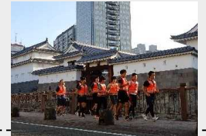
「ながら見守り」(ランニングパトロール)の実施状況