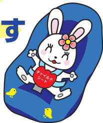
チャイルドシート着用推進シンボルマーク「カチャビヨン」