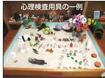
心理検査用具の一例

御家族の方とお子さんそれぞれ面接を行い，知能検査・発達検査等を実施しました。また，知能検査等の結果を，御家族の方に，お子さんの得意なこと，苦手なことなどとお伝えした上で，日頃困っている点や気になっている点をおうかがいしながら，お子さんへの接し方について，アドバイスをいたしました。