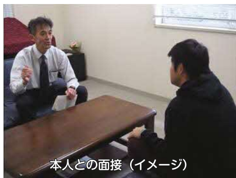
本人との面接（イメージ）