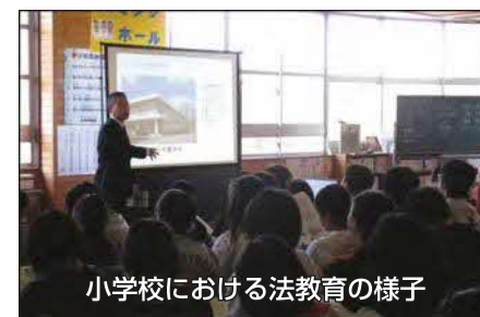
小学校における法教育の様子