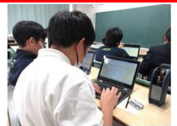
アンケートに回答する様子

☎011-251-0110(内線:3077) (平日午前8時45分~午後5時30分) 質問・申込に関する問合せなど上記まで御連絡ください。 連絡先:北海道警察本部少年課少年育成第一係