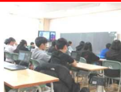
オンラインで説明を聞く子どもたちの様子