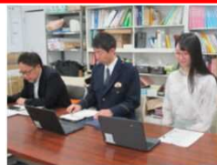
少年課員と学生補導員による説明の様子