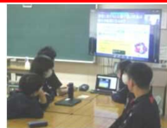
質問に対する回答を交流する様子