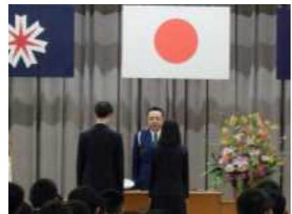
【入学式における交通安全宣言の様子】