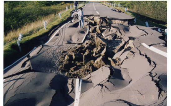
ほっかいどうとうほうおきじしん どうろ がい 北海道東方沖地震による道路のひ害 (別海町)

こんご たいへいよう かいてい はっせい きょだい じしん ひと 今後、太平洋の海底で発生する巨大な地震や人が す ちいき ちか はっせい じしん おお がい 住む地域の近くで発生する地震などによる大きなひ害が しんぱい 心配されています。