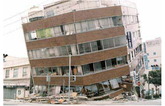
ひょうご けんなんぶ じしん たてもの がい 兵庫県南部地震による建物のひ害

じしん し じしん み まも 地震について知り、地震から身を守るためにどのよう にしたらよいか考えていきましょう。